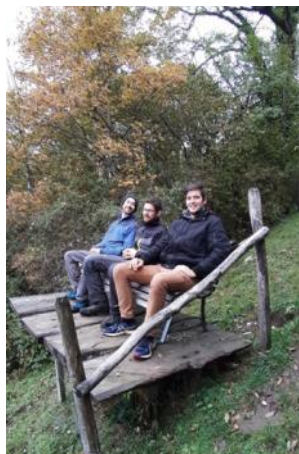
L'avenir du GSEE au repos...