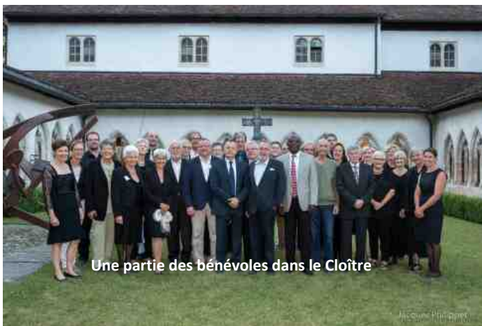
Une partie des bénévoles dans le Cloître

son billet, un disque compact ou boire une coupe de champagne avant d'être accompagné jusqu'à sa place. Présence de bénévoles jusqu'à la fin du concert avant la remise en place des lieux. D'autres personnes indispensables travaillent dans l'ombre. C'est notamment le cas des hommes qui montent et démontent les podiums du cloître et de la collégiale, ou encore qui déplacent l'imposant piano de concert d'un lieu de concert à l'autre. Un piano que quelqu'un chérit, l'accordeur. Avant chaque concert et à l'entracte il vérifie la qualité du son, un travail d'orfèvre.