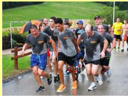
L'arrivée de la joëlette